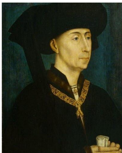
Atelier de Rogier van der Weyden. Portrait de Philippe le Bon, duc de Bourgogne (Dijon, 1396, Bruges, 1467 ; duc de 1419 à 1467), vers 1445. Dépôt du musée d'Art et d'Industrie de Saint-Étienne, 1948, © Musée des Beaux-Arts de Dijon

https://fr.wikipedia.org/wiki/Antoine_de_Bourgogne_(vers_1421_-_1504)